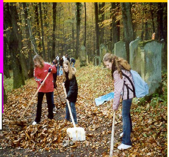
Reinigungsaktion Jüd. Friedhof