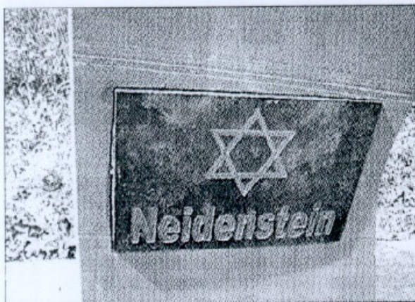
Ein Mahnmal erinnert an die deportierten Juden von Neidenstein.

Am 23. Oktober 2005, wenn sich das schreckliche Datum zum 65. Mal jährt, wird das Mahnmal in Neckarzimmern offiziell der Öffentlichkeit übergeben.