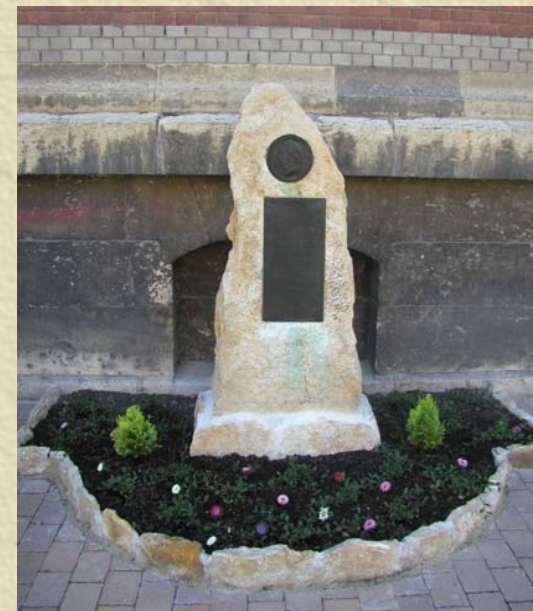
Gedenkstein vor unserer Schule