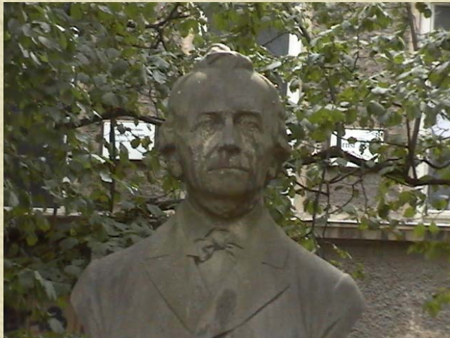
Denkmal am Fürstengraben in Jena